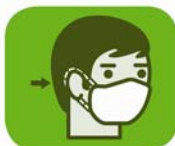
placer le masque sur votre visage et attachez-le