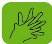
...entre les doigts