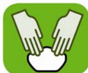
une fois les mains lavées, prendre le masque, le bord rigide vers le haut