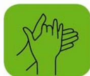
frotter la paume des mains