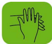
...l'extérieur des mains