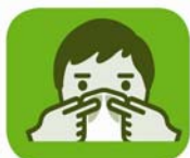
mouler le haut du masque sur la racine du nez