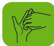
...les ongles et le bout des doigts