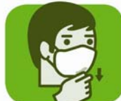
abaisser le bas du masque sous le menton